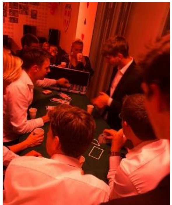
Seniørerne havde en hyggelig afslutningsfest lørdag den 3. november med ca. 40 festdeltagere i klubhuset.