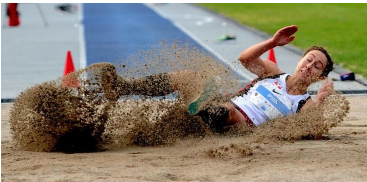
Under et stævne på hjemmebanen i 2017.