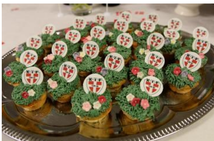
Man nænnede næsten ikke at sætte tænderne i de små kunstværker.