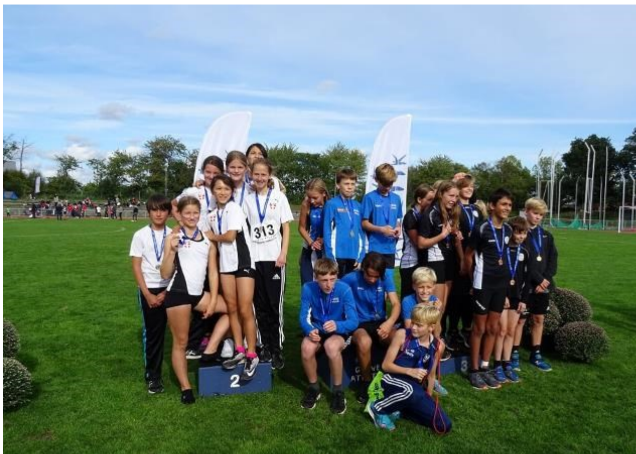
Mix-holdet på 12-13 år kom også på skamlen og vandt sølv med 5.764 points, kun overgået af Holte med 6.294 points. På 3.-pladsen kom Helsingør med 4.988 points.

Alle, der overværede medaljeoverrækkelserne, så hvor betydningsfuld disse holdmedaljer var. De unge atleters fælles jubel og glæde var enestående og smittede af på alle os, der overværede overrækkelserne. Jublen forekom større end under det individuelle mesterskab, der fandt sted i Ballerup tidligere på året. KIF bør lære af dette og tilmelde så mange hold som muligt i 2019. Mon ikke atleterne, der deltog i år, allerede glæder sig til holdmesterskabet i 2019?