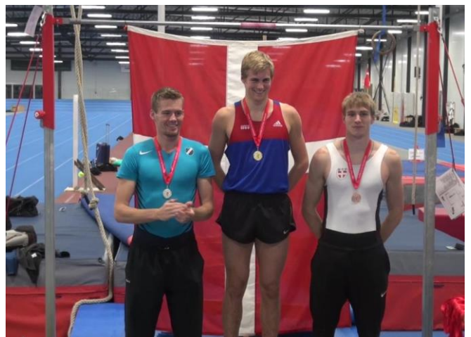
Mikkels velfortjente bronzemedalje